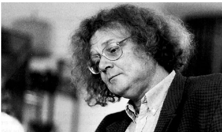
Componist Tristan Keuris.